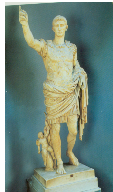
Augusto di Prima Porta