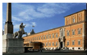
Palazzo del Quirinale

Palazzo dello sport. Domina, su una collinetta, il lago artificiale che la via Cristoforo Colombo supera, dividendosi in due bracci ed è forse la più bella delle strutture sportive realizzate per le olimpiadi. Opera di Marcello Piacentini e Pier Luigi Nervi (1958-60). Può acco-