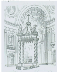
Baldacchino del Bernini

Piazza del Quirinale. Aperta su uno dei più bei panorami della città,