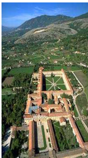
Veduta della Certosa di San Lorenzo

La Certosa di San Lorenzo è detta di Padula per la sua vicinanza all'omonimo paese.